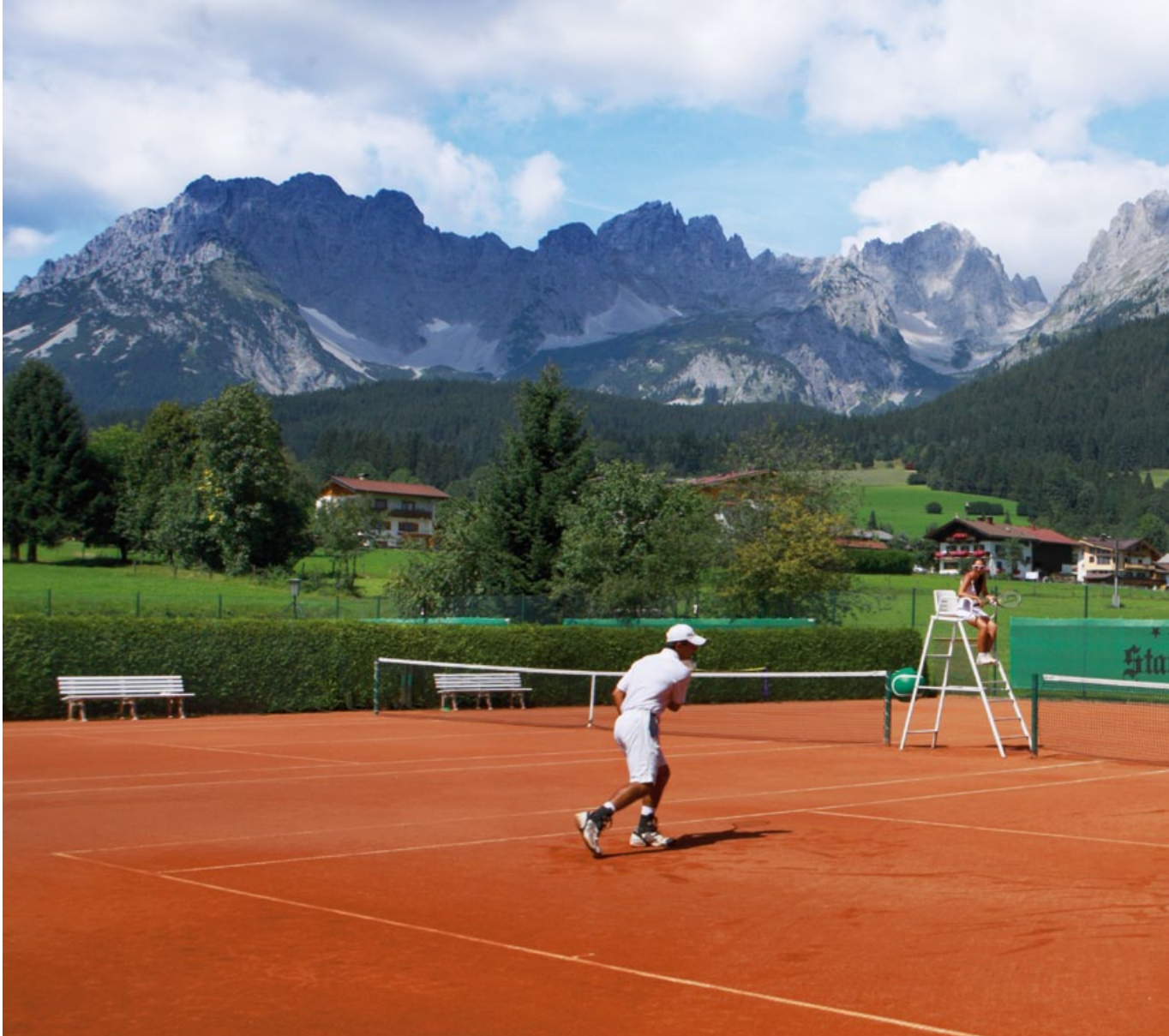
For the love of the game