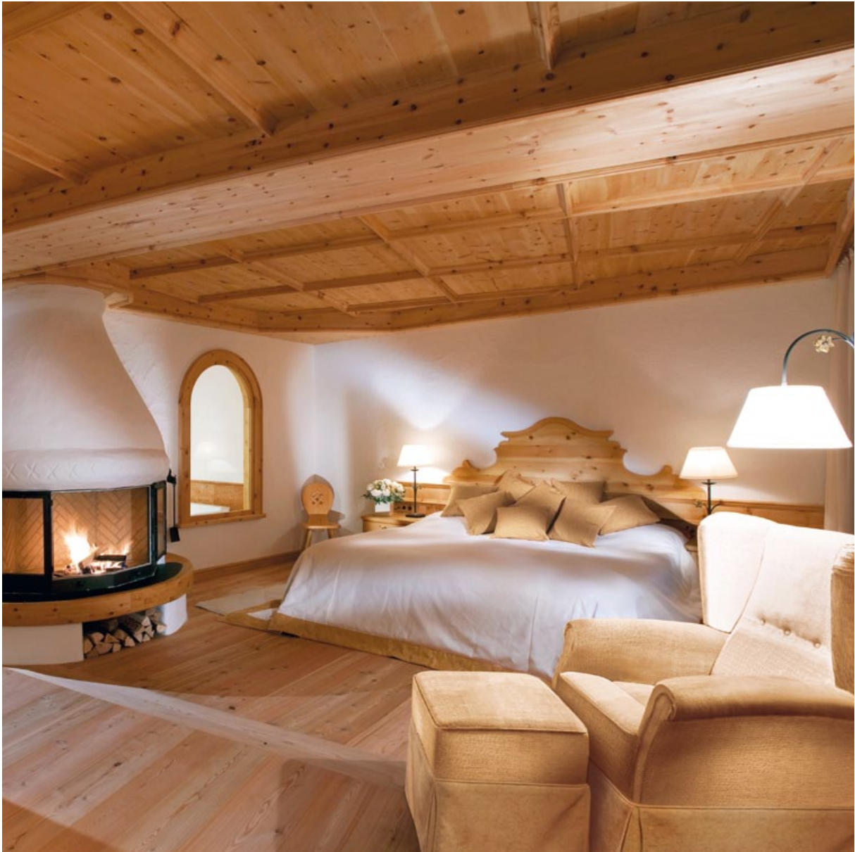
Your 'home' at the Stanglwirt