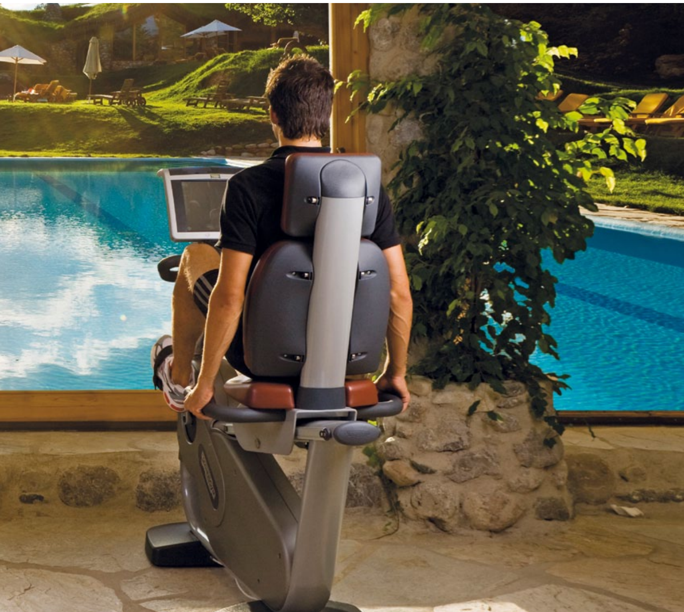
Aktiv sein im Fitnessgarten