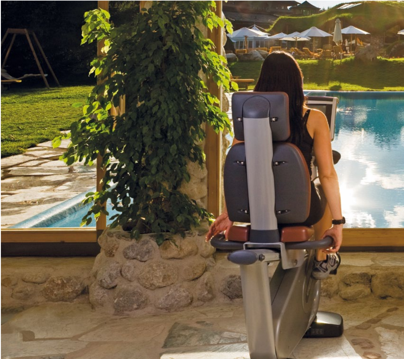
Be active in the fitnessgarden