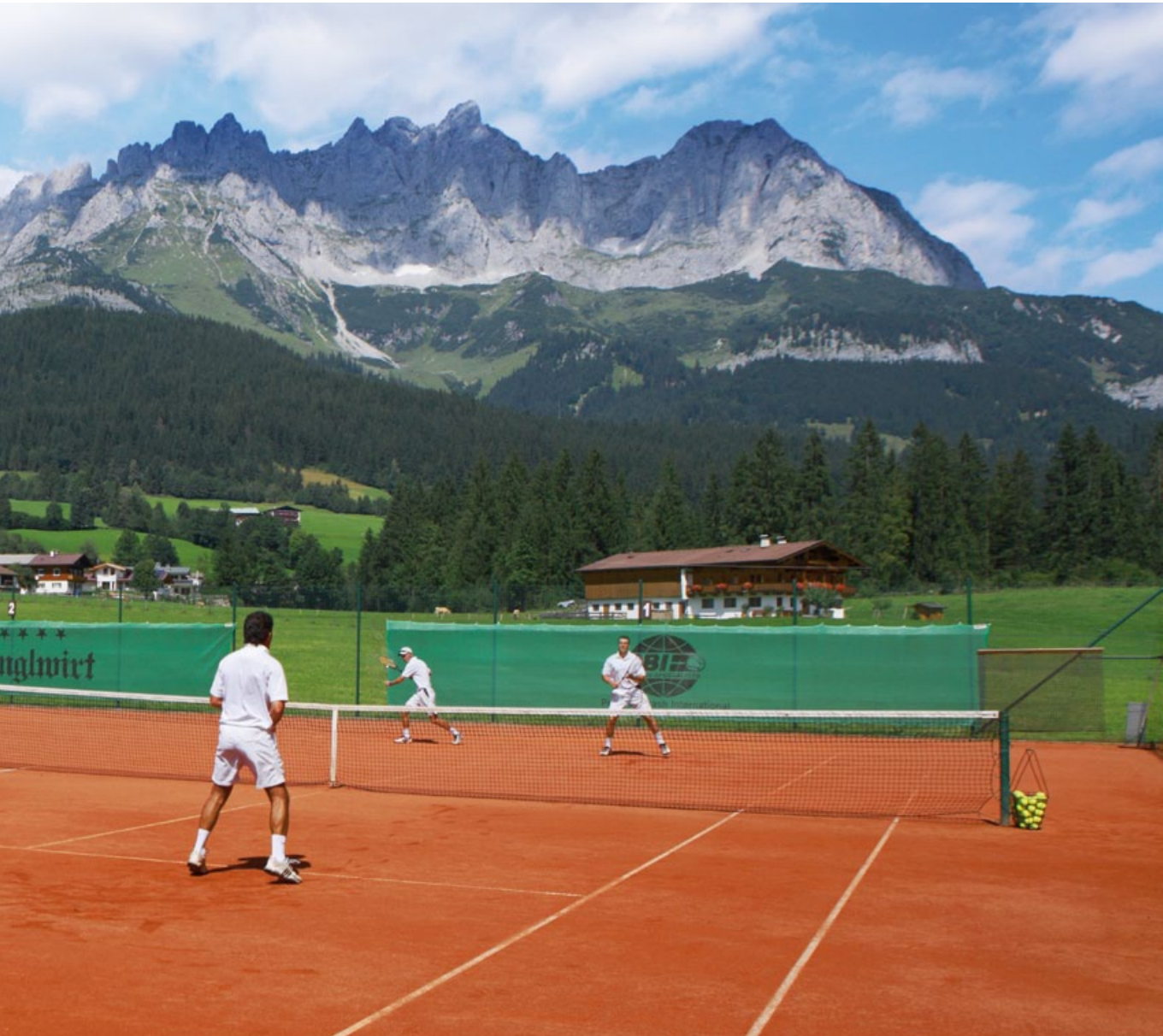
Aus Spaß am Spiel