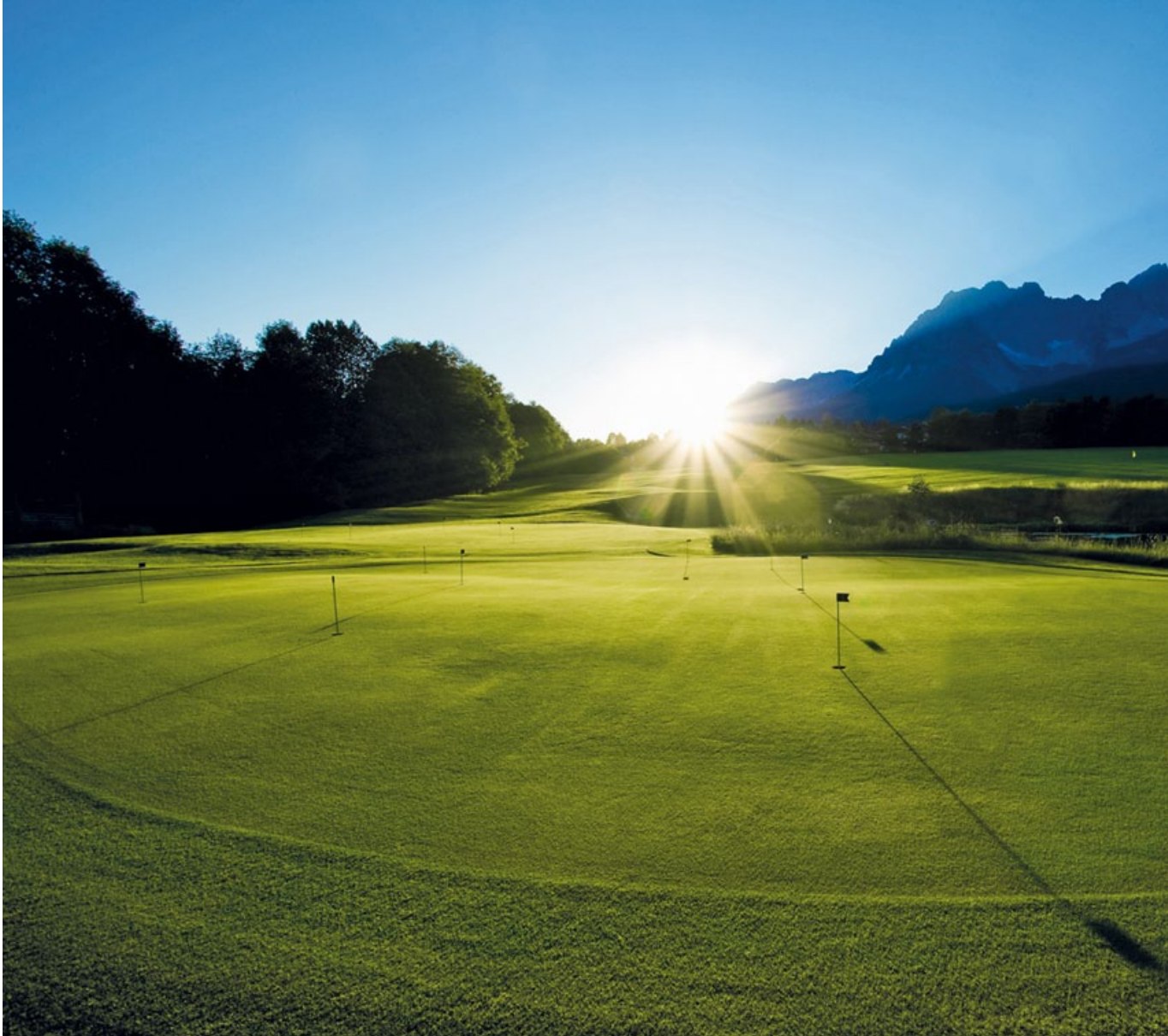
The emperor's golf-paradise