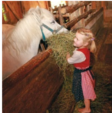
Joyful moments at the children's farm