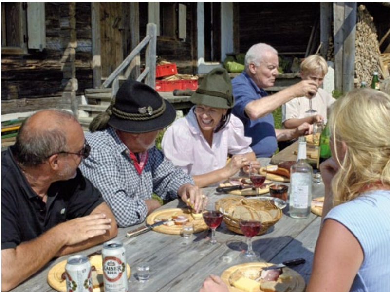
On the Stangl-Alm