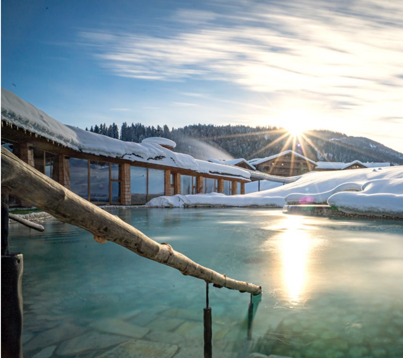
A snowwhite fairytale in the heart of Tyrol