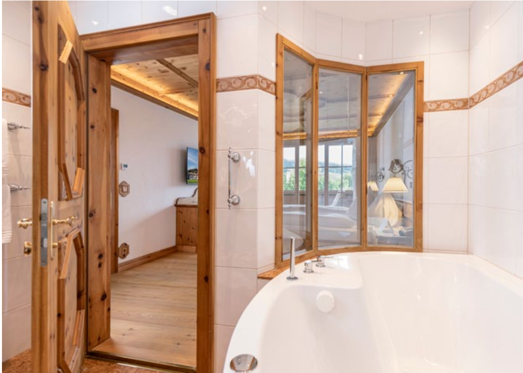
Ihr "Daheim" beim Stanglwirt