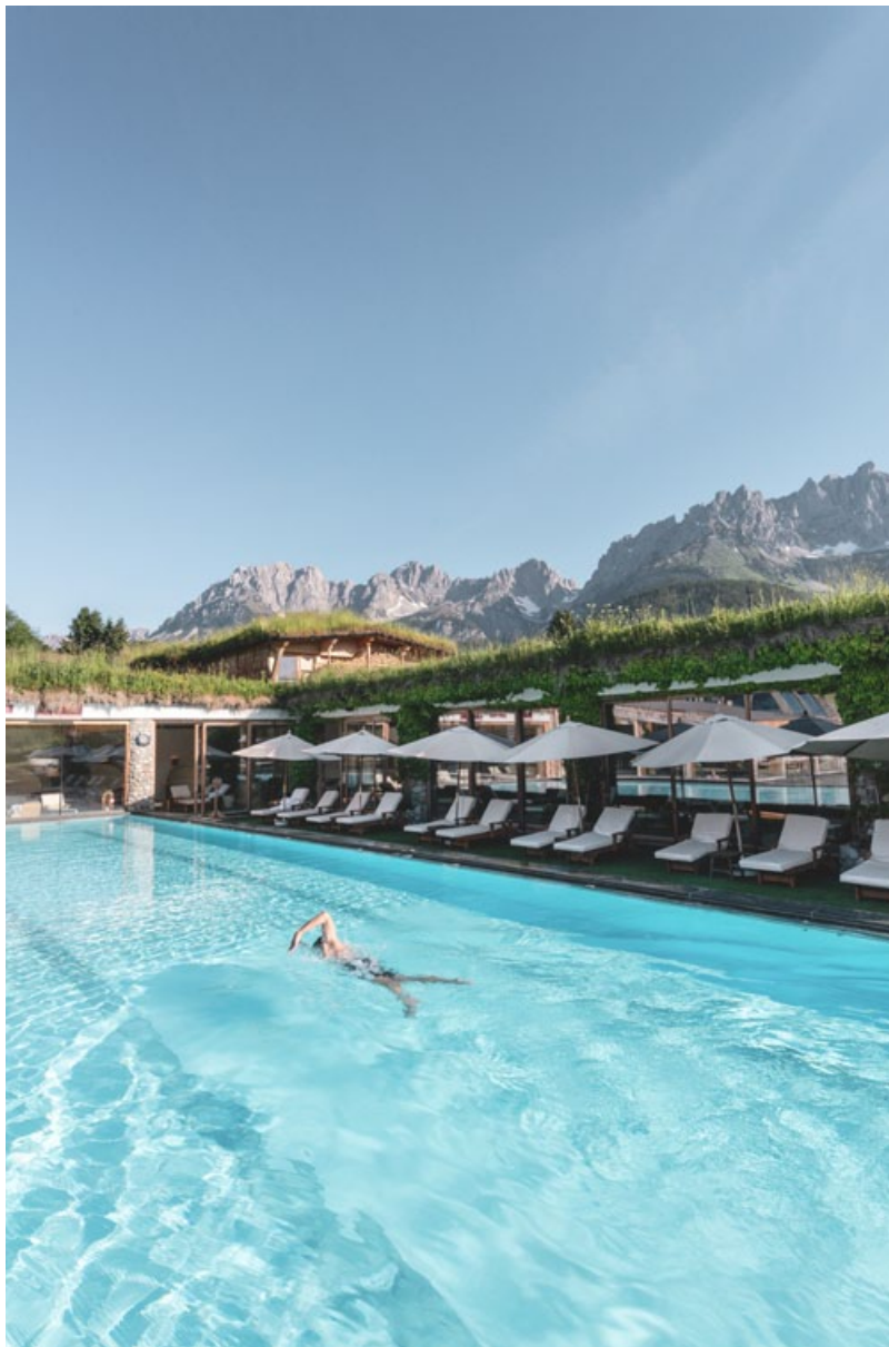
Das Stanglwirt Wasser-Elixier erleben