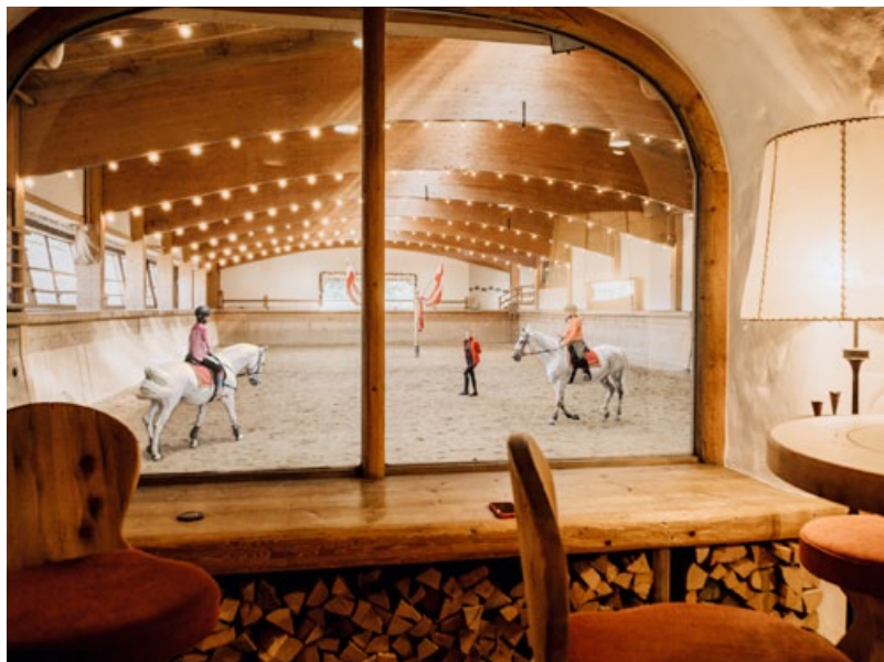
Rendezvous auf der "Tenne"