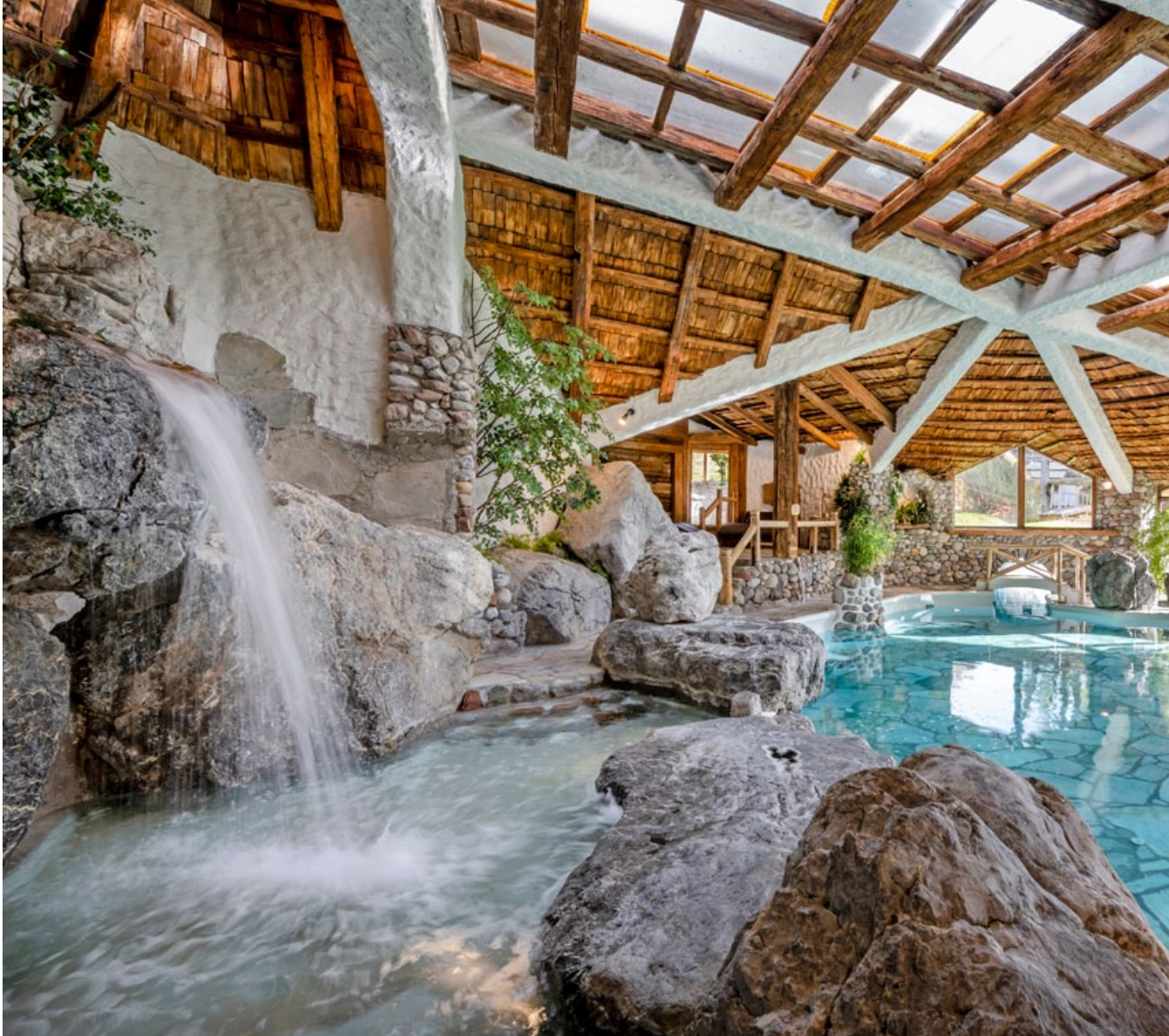
In the world of senses