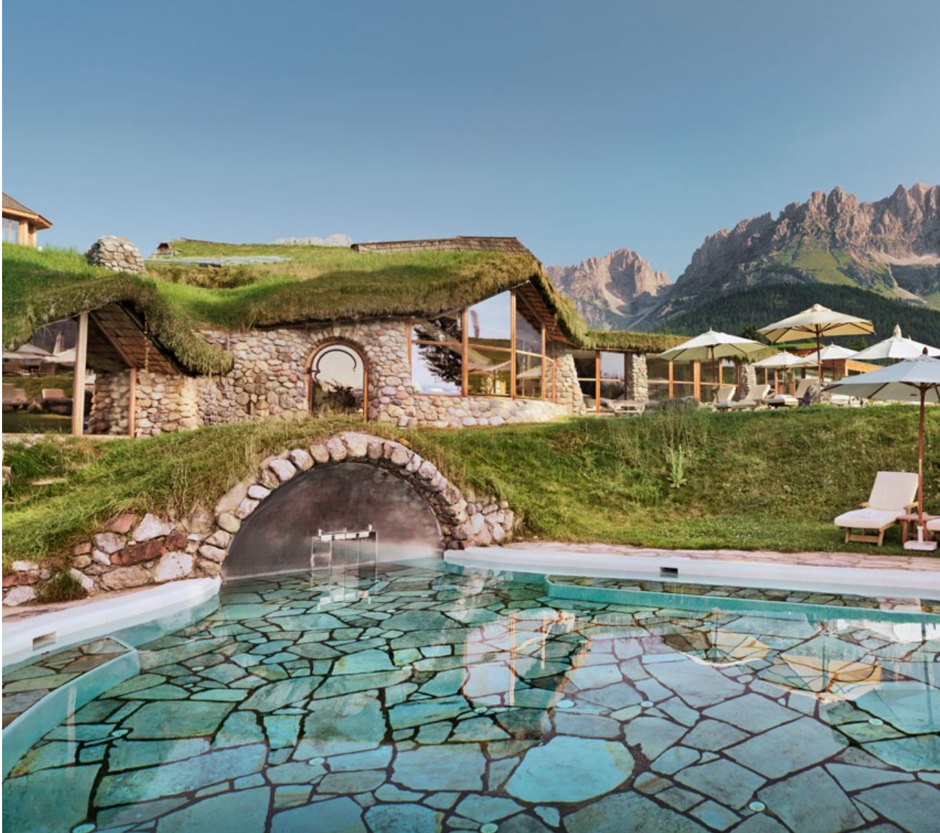
Experience the Stanglwirt water-elixir