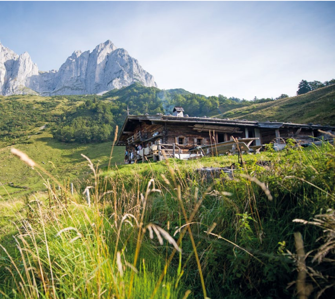
Auf der Stangl-Alm