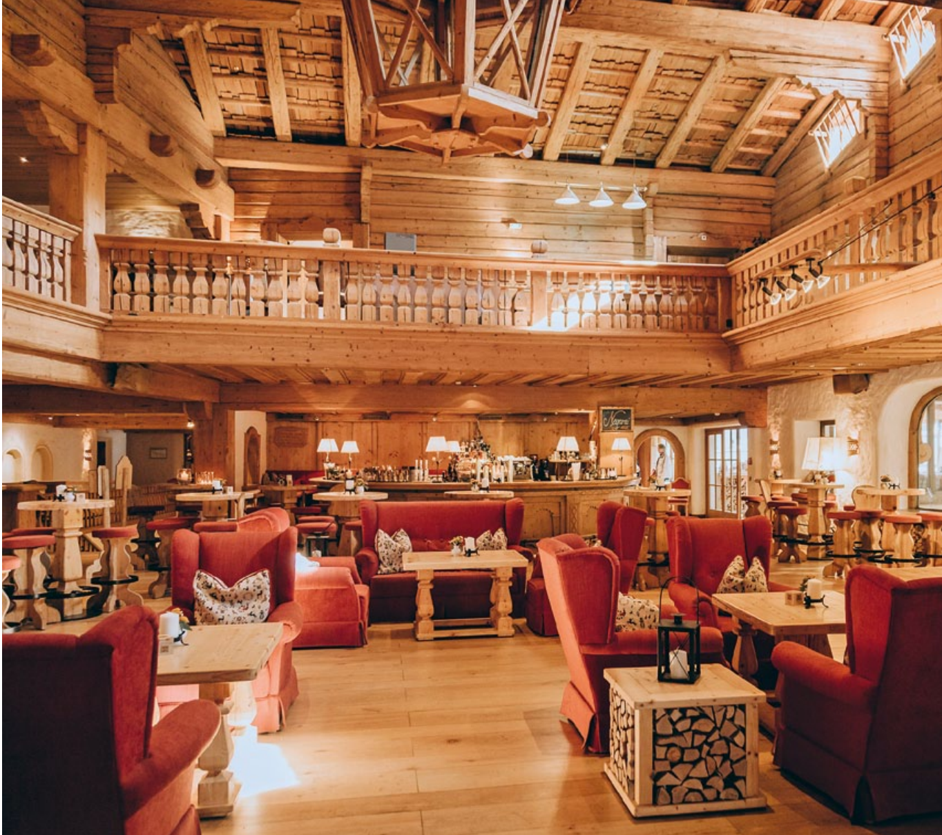
Rendezvous at the 'Tenne'