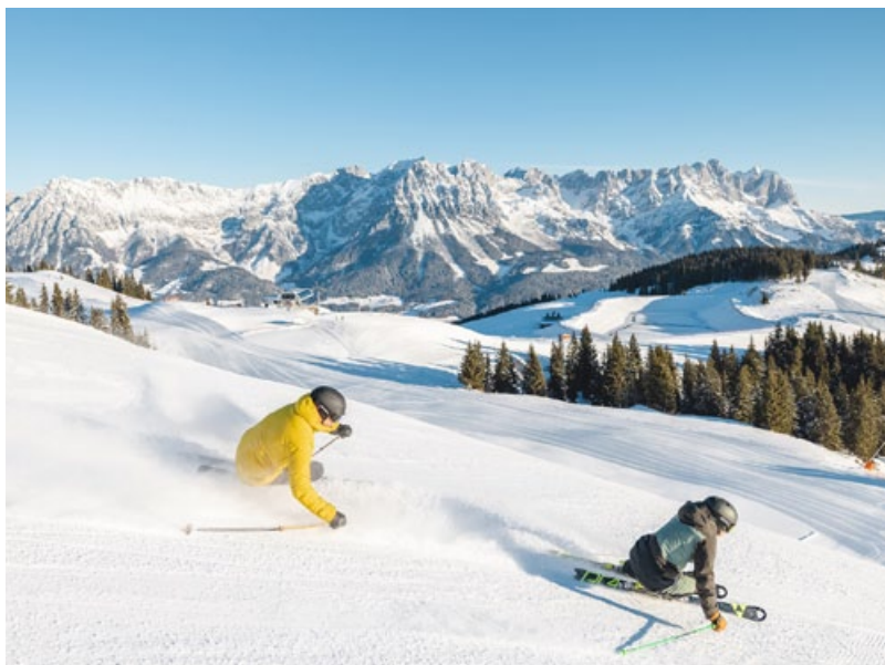
Ein schneeweißes Märchen im Herzen Tirols