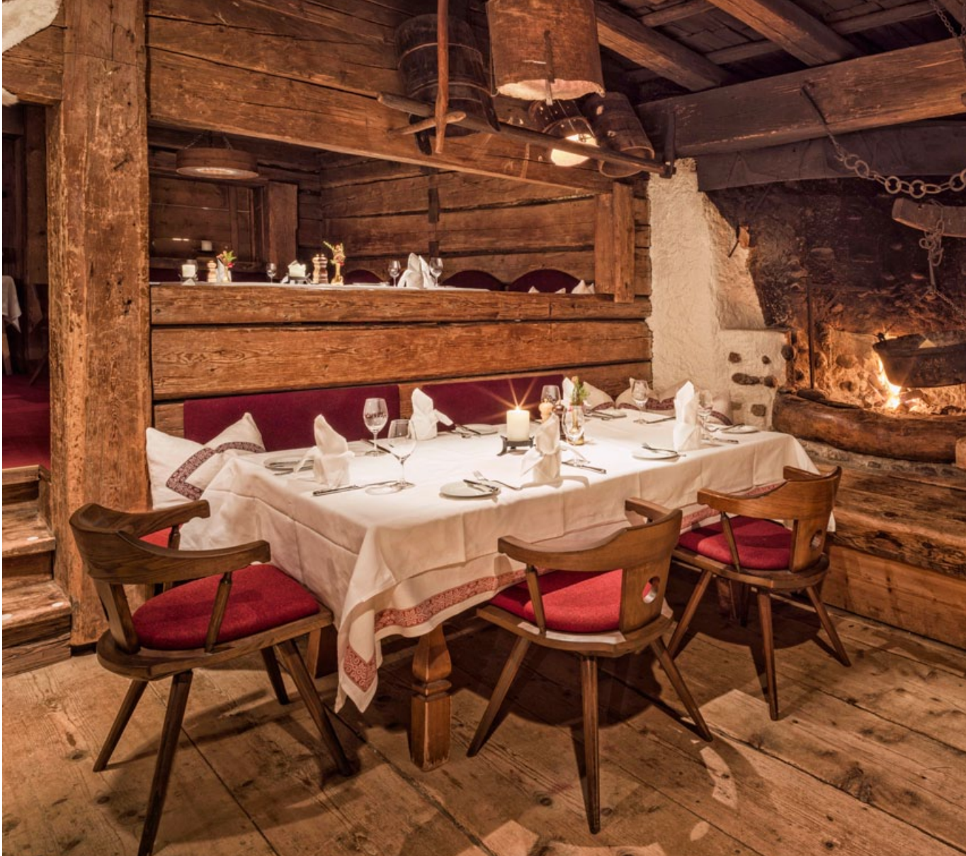
Joyful moments in the 'Gasthof Stangl'