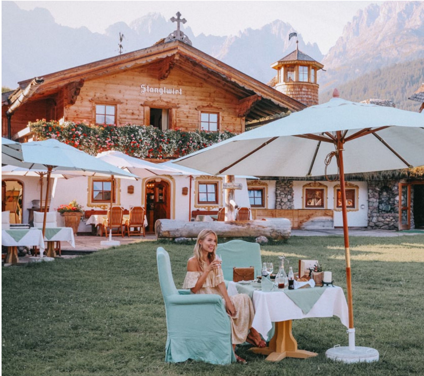
Culinary pleasures with exceptional views