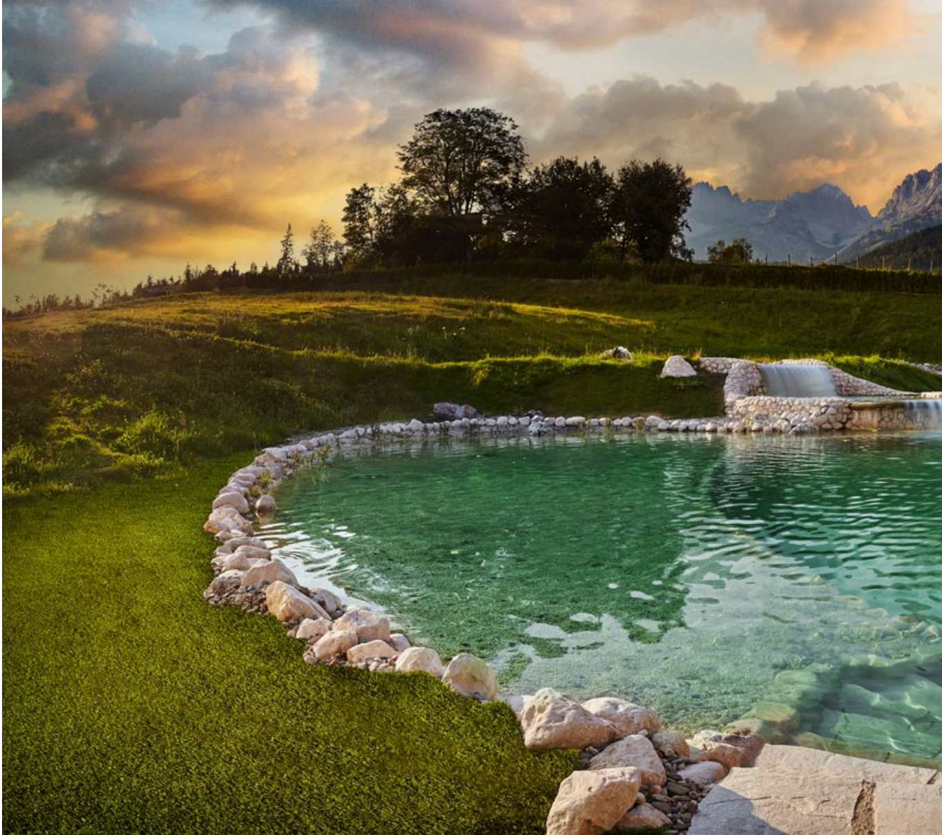
Recharge your soul