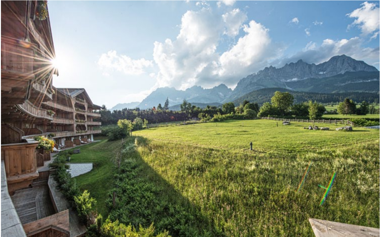
Des Kaisers schönster Anblick / Stunning mountain views